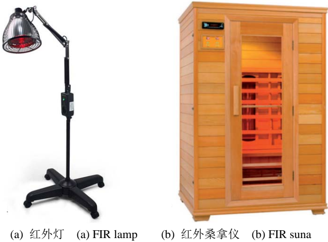
图 1 远红外理疗设备 Fig.1 Far infrared physiotherapy equipment

此外，Jue-Long Wang [7] 从细胞层面探寻远红外线促进神经修复的机理，实验发现 FIR 照射可以在培养早期促进神经元样 PC12 细胞的神经突生长，其作用机制是激活 AKT1 磷酸化。Shanshan Shui [8] 回顾和总结以前的研究结果，认为远红外治疗可能与内皮一氧化氮合酶表达的增加以及一氧化氮的产生密切相关，并且可能调节某些循环 miRNA 的表达。研究 [9] 发现，改善线粒体功能应该是 FIR 生物学效应的主要机制之一，FIR 辐射上调了线粒体复合体 I 的活性，然后增加了 NAD + / NADH 的比例。